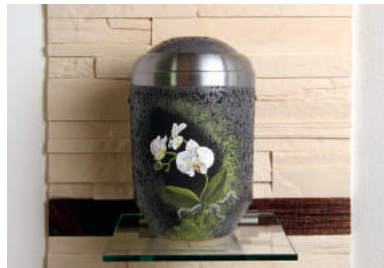
Orchidee Steinurne handbemalt