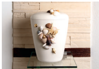
Meeresgold BIO-Urne mit aufgesetzten echten Muscheln, teilweise Blattvergoldung