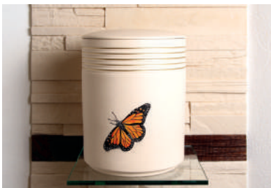
Schmetterling Keramikurne handbemalt