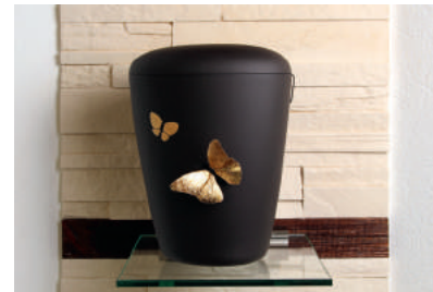
Schmetterling BIO-Urne mit aufgesetztem, vergoldetem Schmetterling