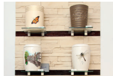
oder ganz nach Ihren Wünschen