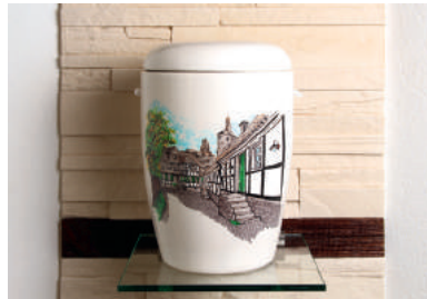
Bensberg Malerwinkel Porzellanurne handbemalt