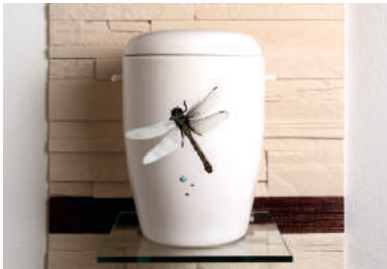
Libelle Porzellanurne handbemalt