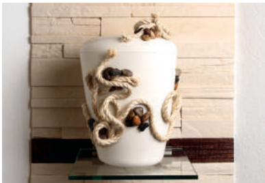
Lebensband BIO-Urne mit Steinen und Sisal