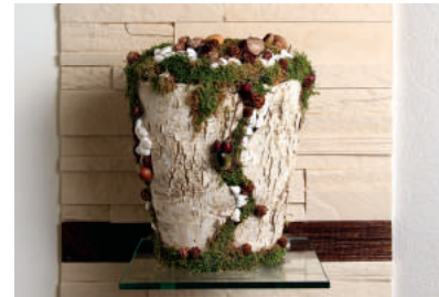
Wald BIO-Urne mit echter Rinde, Moos, Bucheckern und Steinen